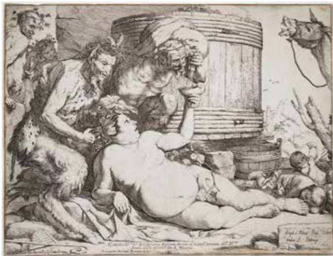
Sileno ebrio José de Ribera, el “Españoleto” Aguafuerte y buril 1649