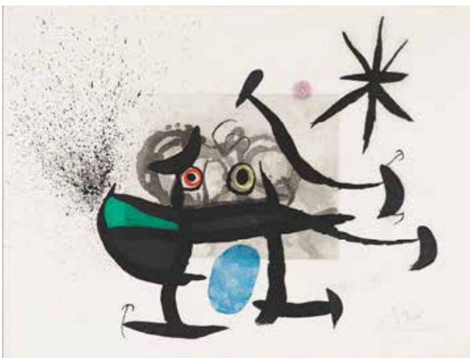
Los vendimiadores Joan Miró Aguafuerte y aguainta Hacia 1963

El vino te atrapa. Discurre por nuestra vida entrando y saliendo, convirtiendo en emociones cada sorbo de su alma. El vino es embriagador, terso, vital, transformando en inspiración aquello que sólo parece un fluido. INSPIRADOS POR EL VINO, MAESTROS DEL GRABADO EN LA COLECCIÓN VIVANCO retrata esta dualidad tan humana, este diálogo entre lo racional e irracional, este ser o no ser donde el vino aparece como materia activa en medio de un momento vital y único para el artista, creando momentos únicos que solo podemos COMPARTIR